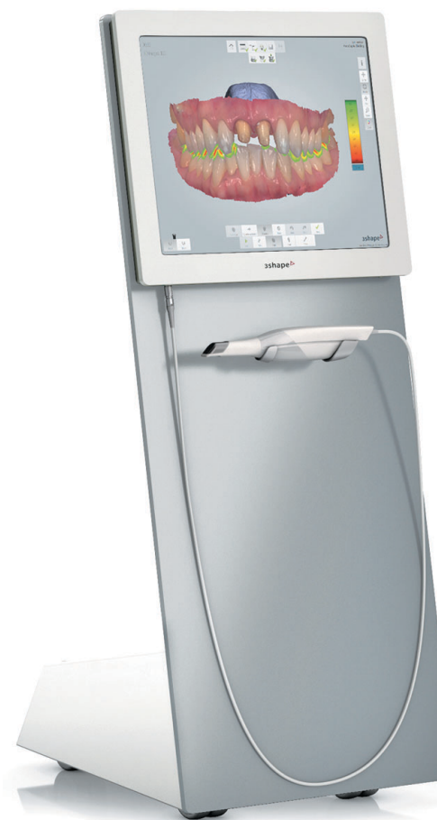
Der TRIOS® 3 Intraoral-Scanner in der Stand-Version.